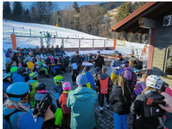
Bericht und Bild: Christian Walter